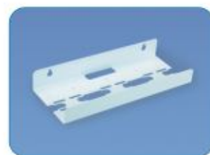
SUP3 - 10