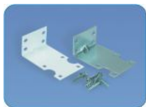
SUP1 - 05