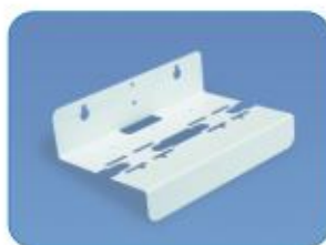
SUP2 - 10B