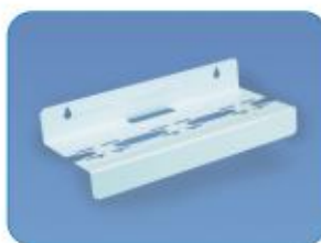
SUP3 - 10B