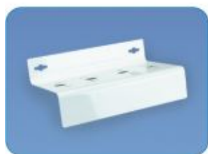
SUP2 - 10BL