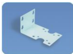
SUP1 - 10