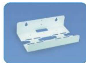
SUP2 - 10