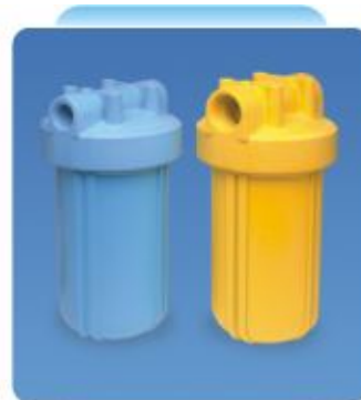
Carcaças sob encomenda