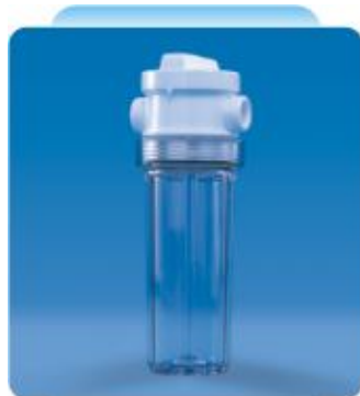
Válvula na cabeça